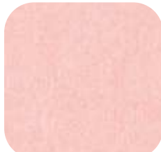
17 | BLUSH 9 MM