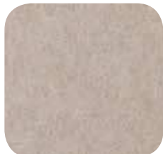
22 | DARK CAMEL 9 MM