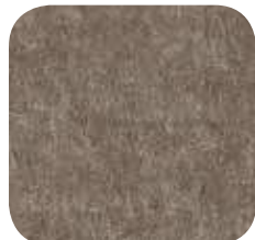
39 | LIGHT OAK 9 MM