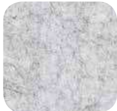
12 | SILVER GREY 9 / 18 / 25 MM