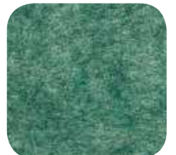
19 | GREEN 9 MM