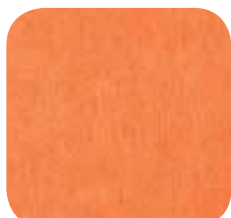
56 | ORANGE 9 MM