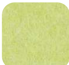
43 | LIME 9 MM