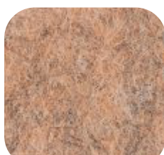
65 | COPPER 9 MM