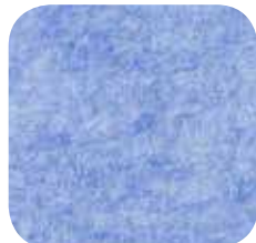
14 | LIGHT BLUE 9 MM