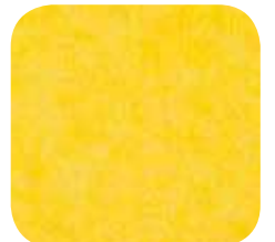
05 | YELLOW 9 MM