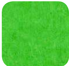
51 | APPLE GREEN 9 MM