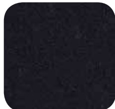
09 | BLACK 9 MM