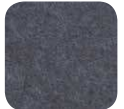
23 | DARK GREY 9 / 18 MM