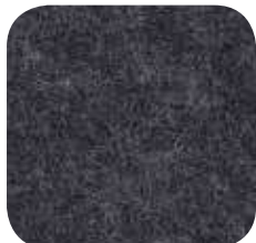
03 | ANTRACIET 9 / 18 / 25 MM