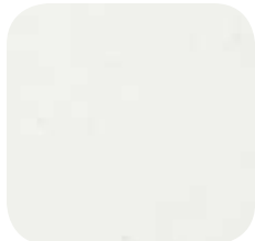
32 | OFF WHITE 9 / 25 MM