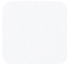
20 | WHITE 9 / 25 MM