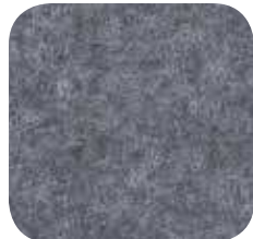
16 | GREY 9 / 18 MM