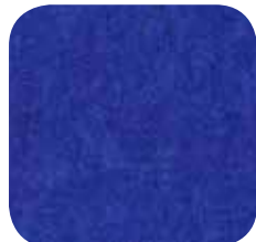
01 | DARK BLUE 9 MM