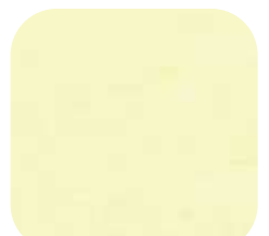
06 | VANILLA 9 MM