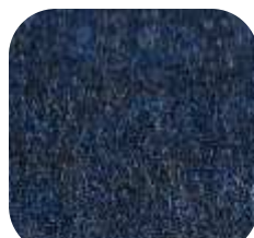
38 | MIDNIGHT BLUE 9 MM