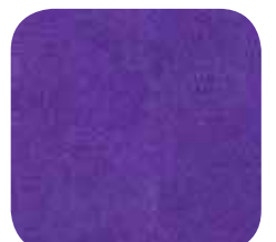
41 | PURPLE 9 MM