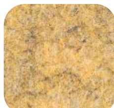
83 | GOLD 9 MM