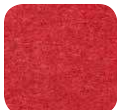
25 | RED 9 MM