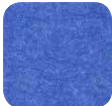
27 | MIDDLE BLUE 9 MM